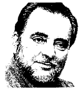
LA COLUMNA INVITADA JULIO ANGUITA

○ Miembro de CEAFFA (Coordinadora Española de Afectados de Fórum Filatélico y Afinsa).